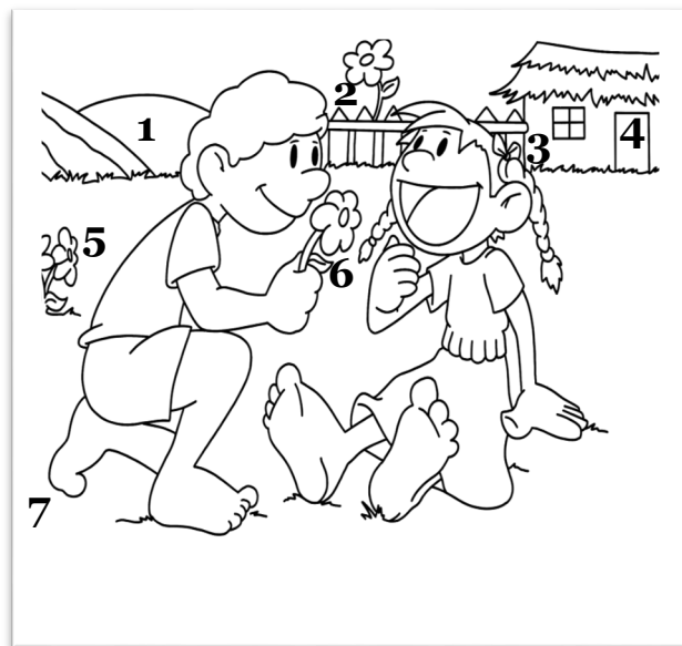
Илюстрации: Петър Цветков - XI и клас