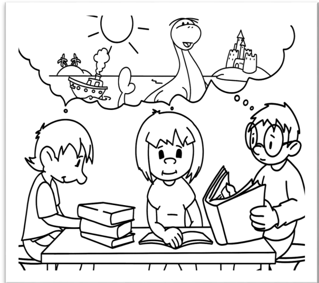
Илюстрации: Петър Цветков - XI и клас